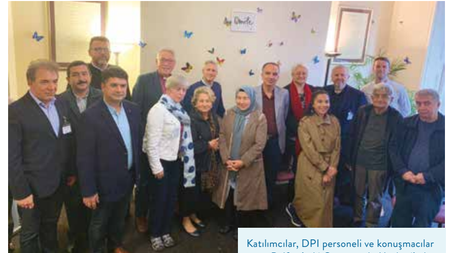
Katılımcılar, DPI personeli ve konuşmacılar Belfast'taki Corrymeela Merkezi'nde.