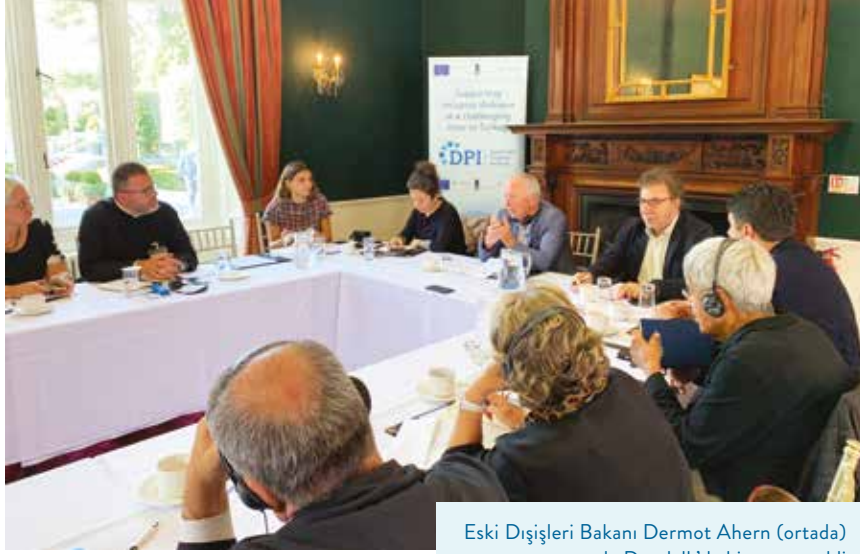
Eski Dışişleri Bakanı Dermot Ahern (ortada) grupla Dundalk'da bir araya geldi

Dermot Ahern: Hepinize hoş geldiniz diyorum; bildiğiniz gibi, burası İrlanda adasındaki iki büyük şehrin tam ortasında yer alıyor. Burası benim memleketim ve Parlamenteoda yaklaşık 21 yıl boyunca temsil ettiğim yer; siz buna ek olarak bir de Belfast'taki Clonard Manastırı'na gideceksiniz, orası da barış görüşmelerinde çok önemli bir mekandı. Belfast'taki Corrymeela Merkezi'ni de ziyaret edeceksiniz; burası adını İrlanda'nın kuzeydoğu ucunda yer alan ve İskoçya'ya doğru bakan bir dini merkezden alıyor. Ben genç bir parlamenterken kraliyetçi veya birlikçi – yani İngiltere'ye bağlı kalmak isteyen – kesime ait terörist ve paramiliter örgüt temsilcileriyle ilk gizli temasları orada gerçekleştirmiştim. Görüşmeler Corrymeela'daki dini topluluk tarafından organize edilmişti.