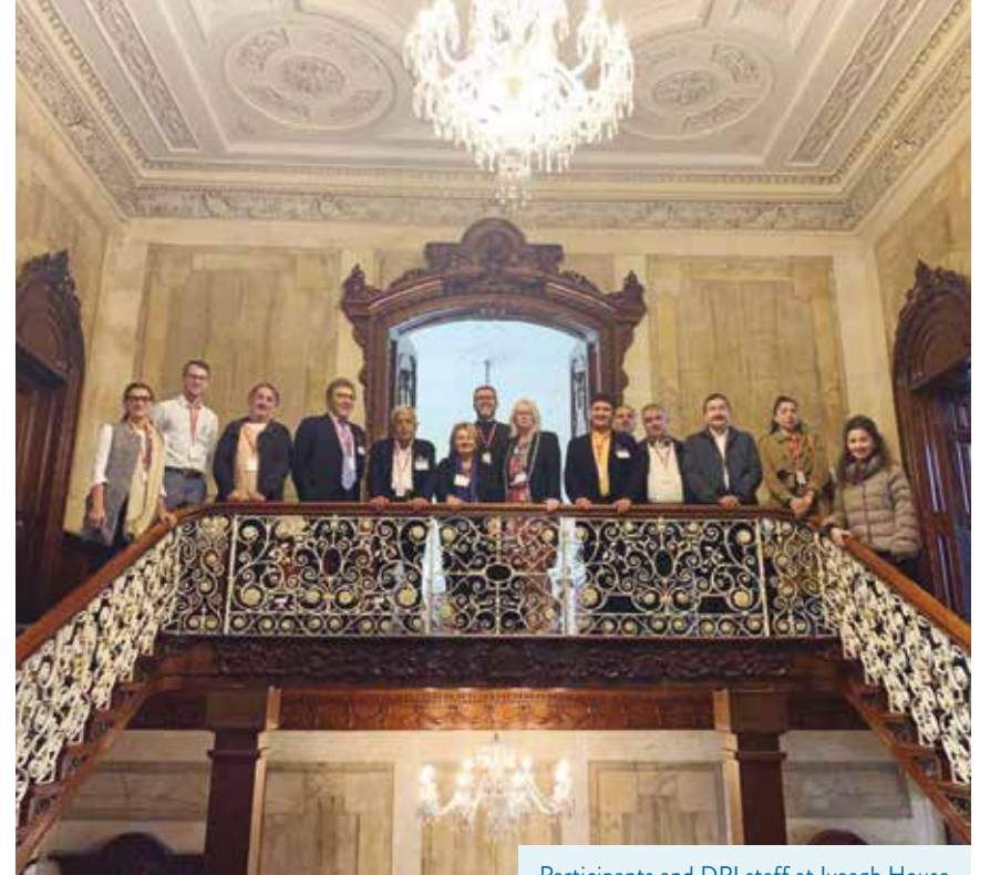
Participants and DPI staff at Iveagh House

Bu İrlanda'da normal karşılanan bir davranış biçimi değil; bahsettiğiniz olay İrlanda'da herkesi çok öfkeliendirdi. "Bilinmeyene karşı duyulan korku" üzerinden tartışma ilerledi; Batı toplumunun gerçek İslam'ı aslında bilmediği konuşuldu. Dolayısıyla insanları, özellikle gençleri İslam üzerine eğitmek gerektiğinden bahsedildi. Müslüman ve Hristiyan cemaatlerin işbirliği yaparken karşılık ve müttekabiliyet ilkelerini siyaseten değil teolojik bir bağlamda yorumlamaları gerektiği ifade edildi.