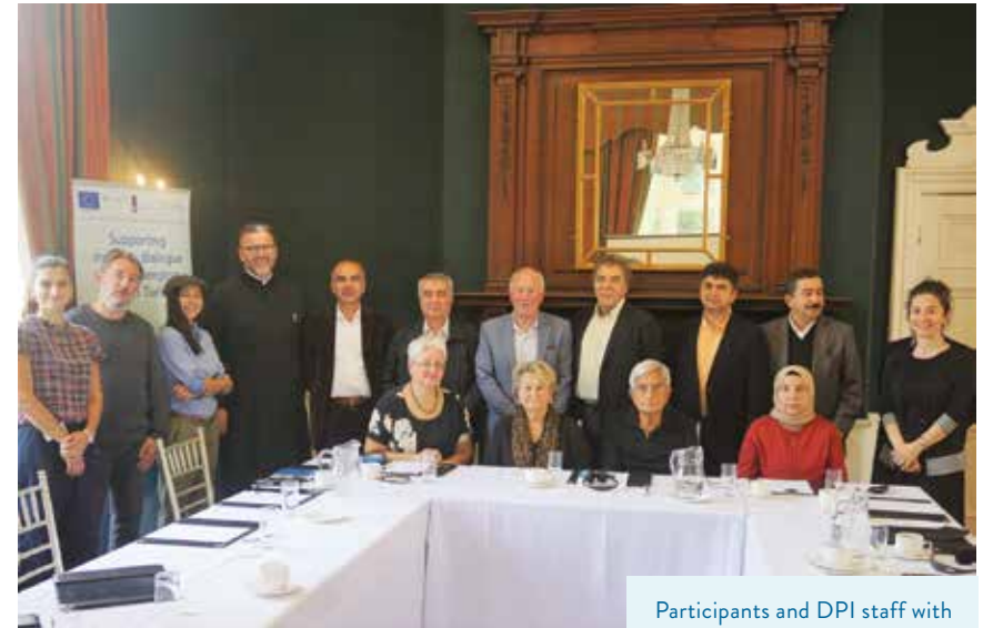
Participants and DPI staff with Dermot Ahern in Dundalk