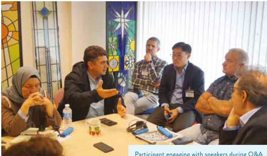
Participant engaging with speakers during Q&A

where it didn’t bother them because they didn’t live there. They didn’t live at the Interface. It’s the people that live at the Interfaces who are the ones who will say ultimately when they feel secure and safe. Then the physical barriers can come down. But the government hasn’t even started to try to take the mental barriers down or make us feel safe in our own communities. No one in government up there, the DUP or Sinn Féin, has given us the confidence that we can move on and create a situation where we trust each other.