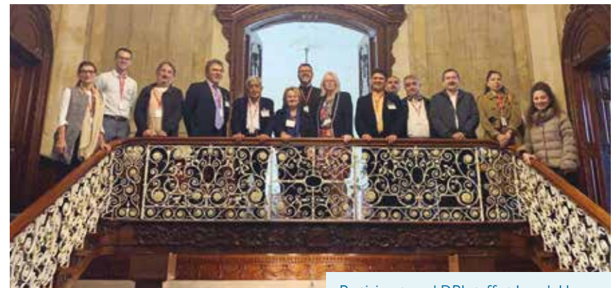
Participants and DPI staff at Iveagh House

» The group also raised that when Muslim and Christian communities work in cooperation, they must always consider the theological interpretation of reciprocity, not the way that politicians interpret the term reciprocity. This point was raised to highlight the different mentalities that abound in different cultures over what can be worn when working in public as religious leaders.