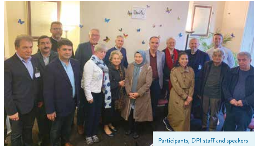
Participants, DPI staff and speakers at Corrymeela centre, Belfast