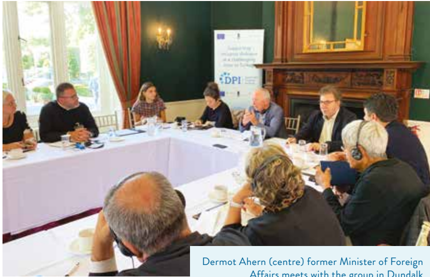
Dermot Ahern (centre) former Minister of Foreign Affairs meets with the group in Dundalk

Dermot Ahern: I would like to welcome each and every one of you to this area, which as you know, is exactly halfway between the two major cities upon the island of Ireland. Not only are you coming to my hometown and the area that I represented in Parliament for nearly 25 years, you are also going to Clonard Monastery in Belfast, which was very pivotal in some of the peace negotiations. You are also going to the Corrymeela Centre in Belfast, which is named after, and is part of, a religious centre on the very northeast tip of the island which actually looks out onto Scotland, Corrymeela. This is where I, as a very young member of Parliament, had some of the initial secret contacts with representatives of the loyalist, or the unionist – the people who wanted to remain British – terrorist and paramilitary organisations. At that time, they were organised by that religious group based in Corrymeela.