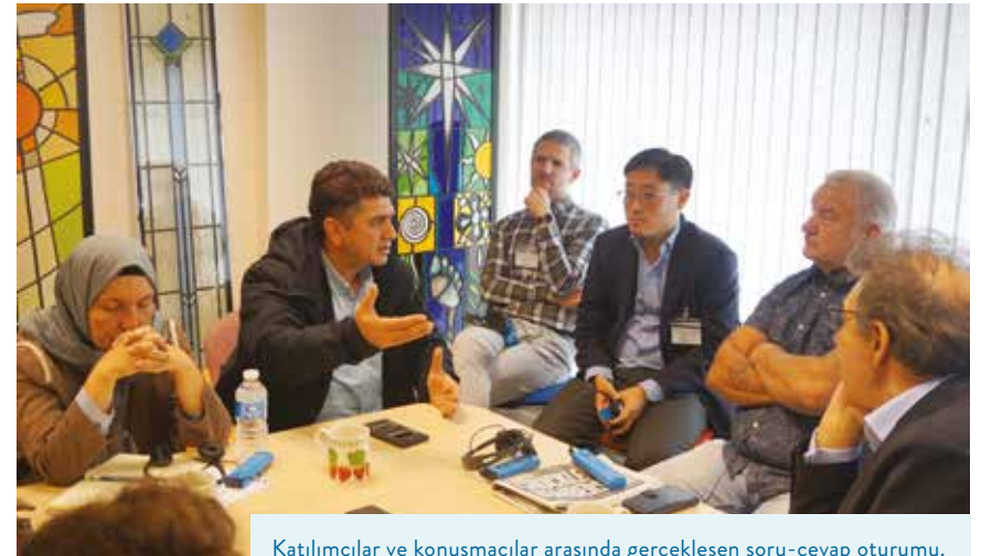
Katılımcılar ve konuşmacılar arasında gerçekleşen soru-cevap oturumu.