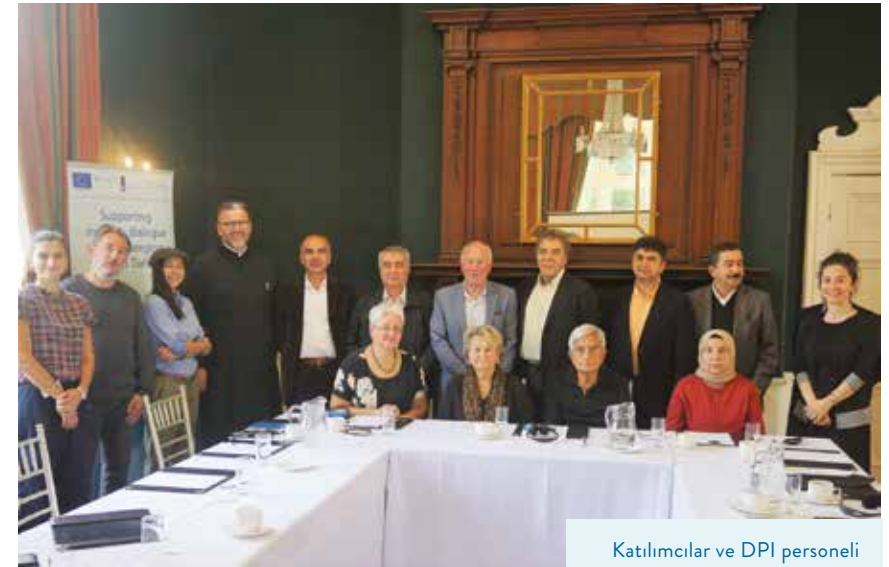
Katılımcılar ve DPI personeli Dermot Ahern ile Dundalk'ta