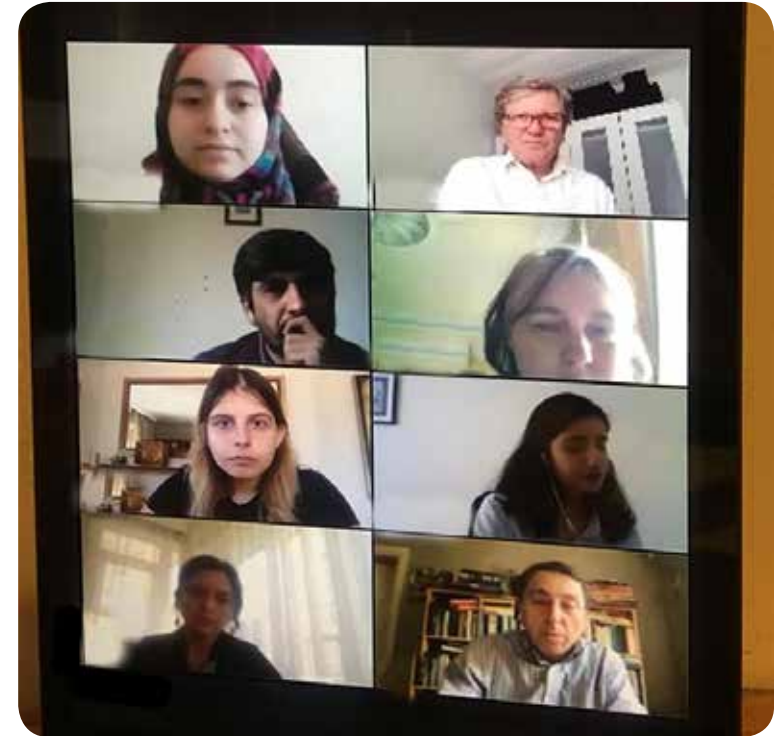
A screenshot of some participants engaging in the Q and A session.

Burada dikkate almamız gereken şu: teknolojiyi yok sayamayız; her daim hesaba katmak zorundayız. Dolayısıyla gizli görüşmeler yapılırken teknolojinin ortaya çıkarabileceği sorunları değerlendirmek ve bunlara karşı tedbir almak önemli. Örneğin çok iyi giden gizli barış görüşmeleri, etkili bir sosyal media kampanyasıyla bir gecede mahvolabilir. Siber güvenlik önemli bir mesele; gizli görüşmelerin sabote edilmemesi ve sızıntılar yaşanmaması için tedbirler alınmalı. Zira taraflar birbirlerine güven duymaya başlamadan yaşanan bu tür so-