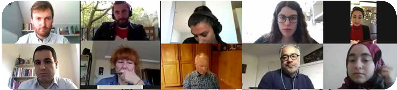
A screenshot of some participants engaging in the Q and A session.

Nevertheless, this shift should also not be exaggerated since it could also be argued that big tech companies, such as Google, Microsoft, Amazon, are now working with the military and intelligence services.