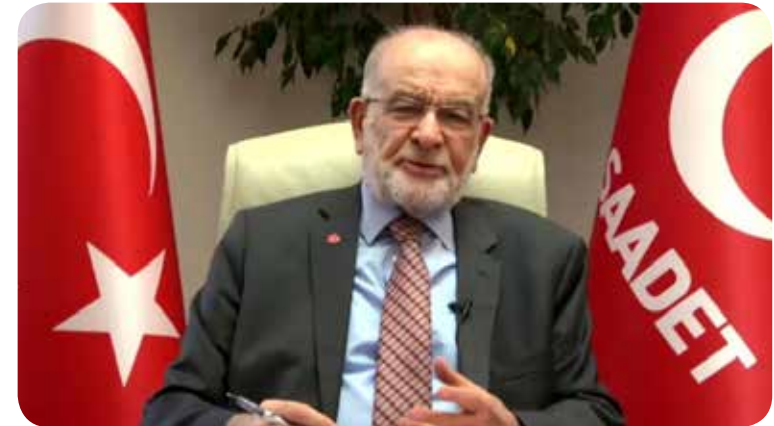
Temel Karamollaoğlu, Leader of Saadet Party.

Karamollaoğlu sunumu boyunca anlaşmazlıkların barışçıl bir biçimde ve diyalogla çözülmesinin önemini altını çizdi. Türkiye şu anda pek çok sorunla karşı karşıyadır, bunlardan biri de iktidar partisinin uzun süredir devam eden yönetimidir. Karamollaoğlu, Türkiye'nin, insanların özgürce konuşabileceği bir barış ve diyalog ortamına ihtiyaç duyduğunu, bunu da iktidar partisinin sağlamasının gerektiğini ifade etti. Kendisi aynı zamanda adaletin mülkün ve devletin temeli olması gerektiğini, çünkü adaletsizliğin polis devleti ile sonuçlanabileceğini