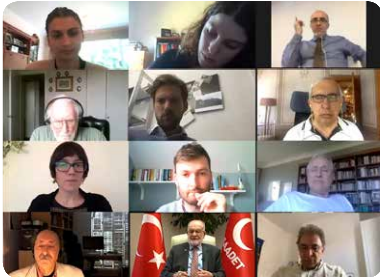
Temel Karamollaoğlu, Leader of Saadet Party, speaking to participants during the roundtable.

Karamollaoğlu began by saying that there is a need for the opposition to be more coherent. They should be able to form alliances. There have been some attempts in this regard. However, because of certain political games that aim to prevent the opposition from coming together, it is not easy to form a unified voice against the current situation in Turkey. Furthermore, the parties have serious concerns about how different voter bases would react. Voters have their sensitivities that cannot be easily ignored.