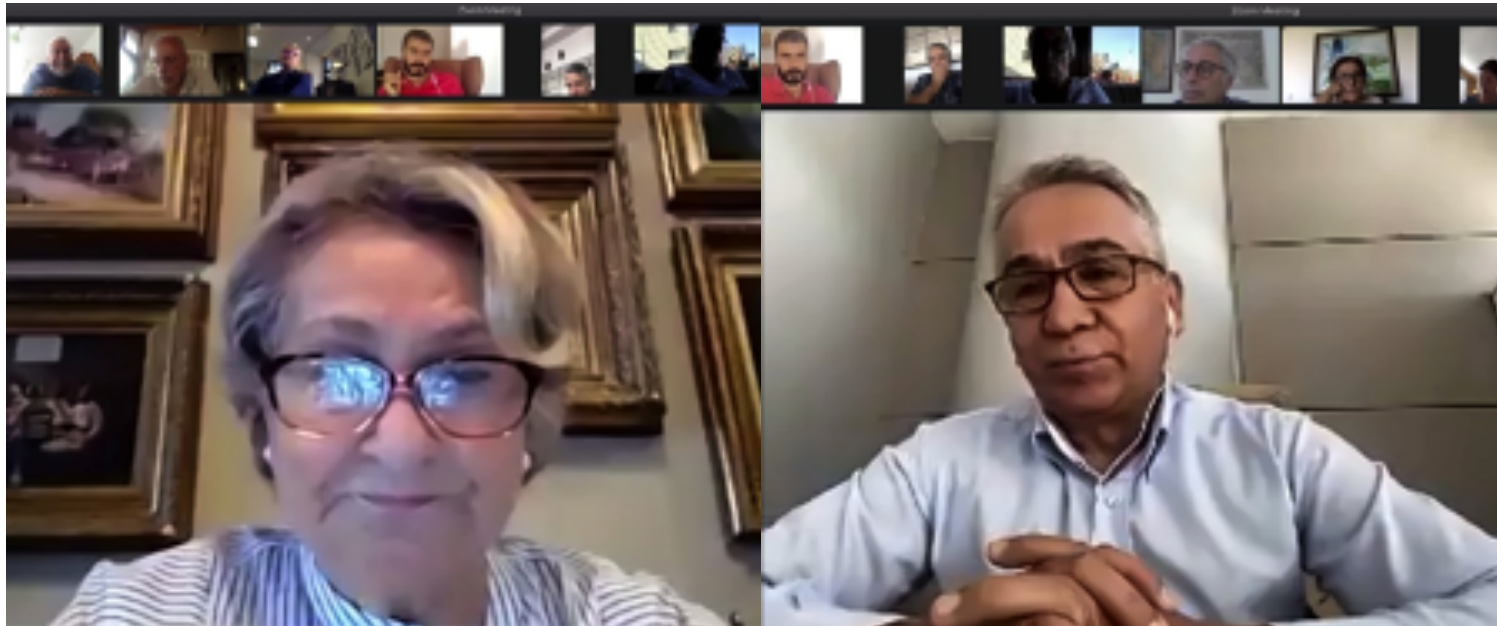
Participants asking questions in the course of the discussion session.

İstanbul'daki seçimlerden önce parti yetkilileri, Kürt kanaat önderleri ve bu konuda çalışan farklı kişilerle fikir alışverişinde bulunmak için bir araya geldi. Bu süreç seçimlerle durma noktasına geldi ama par-