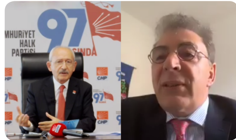
Kemal Kılıçdaroğlu, President of the Republican People's Party (CHP), speaking during the online roundtable.

Çevrimiçi toplantı, Kemal Kılıçdaroğlu ve katılımcıları sıcak bir şekilde karşılayan DPI İcra Kurulu Başkanı Kerim Yıldız tarafından başlatıldı. Yıldız açılış konuşmasında CHP'nin son yıllarda parti içi seçimler için kadın ve gençlere kota uygulamasının yanı sıra toplumun dini ve muhafazakâr kesimleriyle köprüler kurulması da dahil olmak üzere yaşadığı değişikliklere dikkat çekti. Kılıçdaroğlu, kongre sırasında yaptığı konuşmada, CHP'nin Türkiye'de Kürt sorununu çözebilecek tek parti olduğunu belirtti. Yıldız CHP'nin mevcut durumdaki rolünü ve olası bir çözüm sürecine yönelik zorlukları ve fırsatları tartışmak üzere sözü Kılıçdaroğlu'na verdi. Kemal Kılıçdaroğlu, hükümetin COVID-19 salgınıyla nasıl başa çıktığına değinerek konuşmasına başladı. Hedefin pandemide halk sağlığına yönelik tehditlerin üstesinden gelirken bir yandan da toplumsal, politik ve ekonomik kayıpları en aza indirmek olması gerektiğini belirtti. Bu faktörlerin hepsi kesişiyor; Kılıçdaroğlu buna örnek olarak işyerlerinin kapatılması veya sokağa çıkma yasakları örneğini verdi. Bu eylemler halk sağlığını güvence altına alır, ancak işsizlik üzerinde de etkileri olur, bu da yoksulluğa yol açar. Kılıçdaroğlu hükümetin durumu tam olarak kavradığına inanmıyor ve uzun vadeli bir strateji olmaksızın aceleyle kararlar aldıklarını