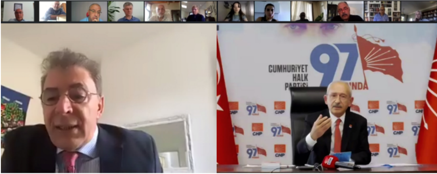
Kerim Yıldız and Kemal Kılıçdaroğlu engaging with participants over online platform.