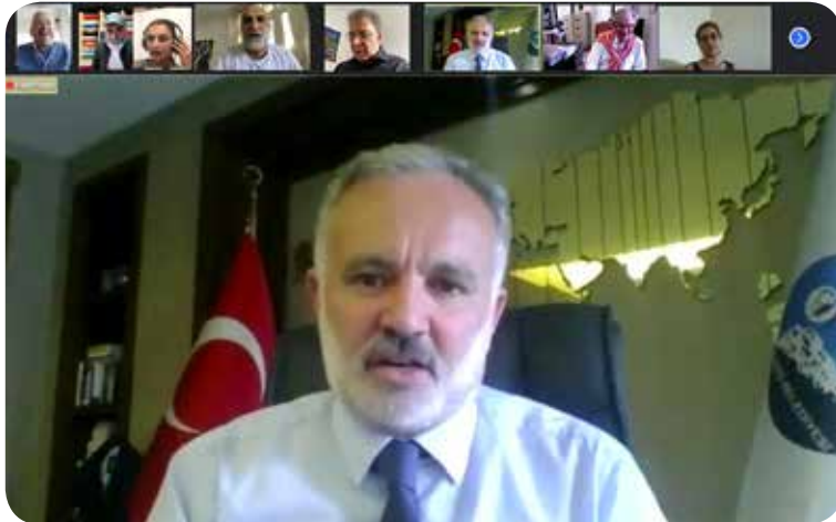
Ayhan Bilgen, co-Mayor of Kars.

Ayhan Bilgen began his speech by drawing a general framework about the impact of COVID-19 on Kars. He stated that the curfews had a great impact on various aspects of the city life. There were high levels of infections in many rural areas. Within the municipality of Kars, a women's unit was formed to address the rise of domestic violence as a result of nation-wide curfews, to provide psychological help. The Kars Women Entrepreneurial Association also started education programmes for women living in the municipality in order to boost employment and participation of women, to integrate women into sectors such as tourism and agriculture. Thus, encouraging a more active participation in the economy. Solidarity units were also established to ensure economic prosperity and aid to families in need. Bilgen's office reinforced all the measures in supporting women and combating unemployment during the pandemic, through efforts of bolstering societal interdependence. Kars cannot allocate its own city budget to these units, therefore, social sol-