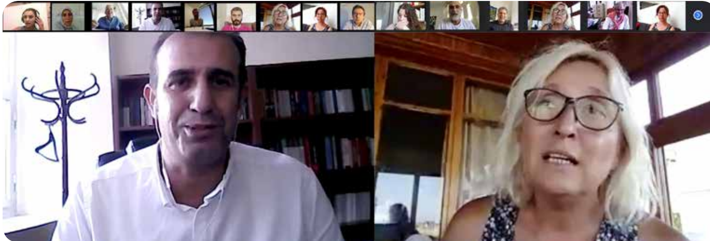
Participants during the discussion session.

Ermenistan sınırı bir zamanlar açıktı ve yeniden açılabilir. Halk iş yapmak, yeni ilişkiler kurmak ve yerel ekonomiyi canlandırmak istiyor. Sınır açılırsa kötü bir şey olmayacağını biliyorlar. Kars'ın köylerinde çeşitli kiliseler var; Gregoryen, Ortodoks ve Protestan kiliseleri. Bunlar yenilenip yeniden açılırsa turizmde bir artış olacaktır. Bu da din-