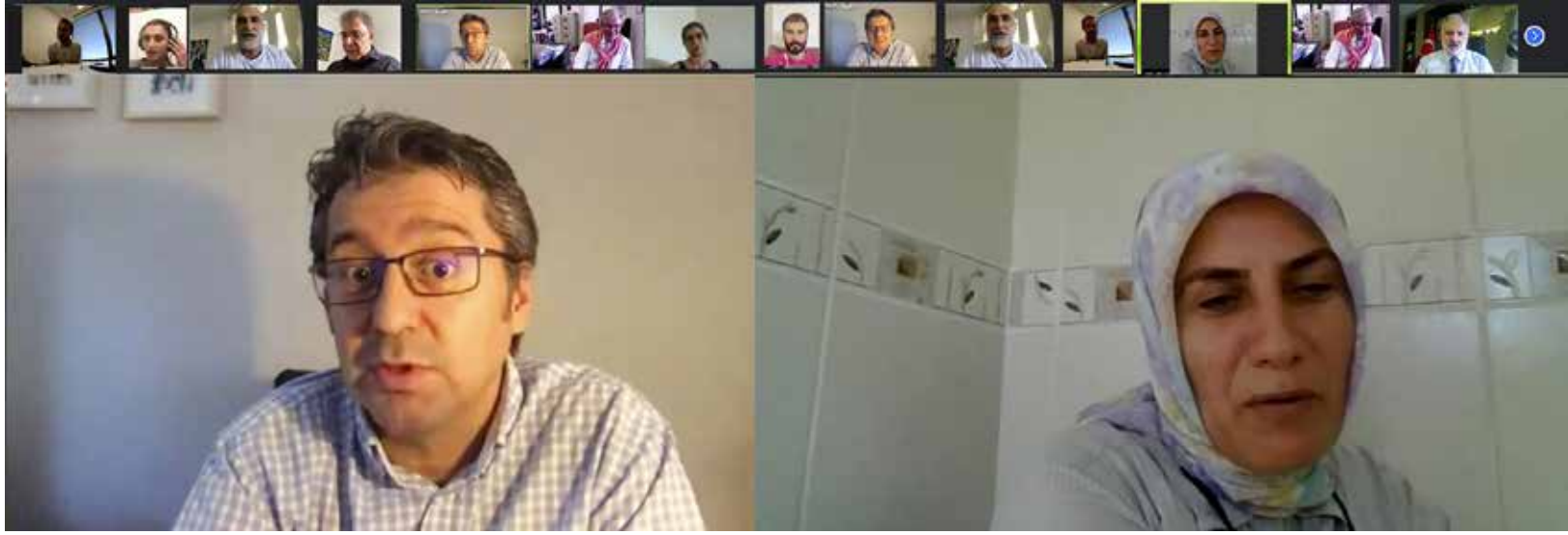
Participants during the discussion session.