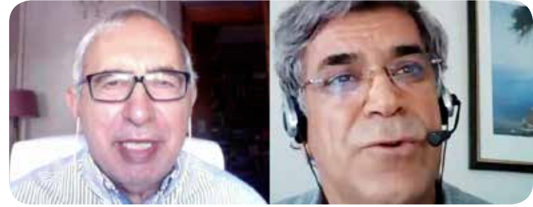
Participants ask questions during the discussion session.

Referring to the previous questions, the participant underlined the fact that Northern Ireland is a very young society. Therefore, discussing the kind of future people want is very important. In this sense, it is also important to note what kind of futures are being offered to people. Will this future be within a United Ireland, Northern Ireland, a variation of federalism, or within the UK? Here, a lot also depends on the reaction of the Republic of Ireland. If they look inwards and do not take account of Northern Ireland, it will be a step