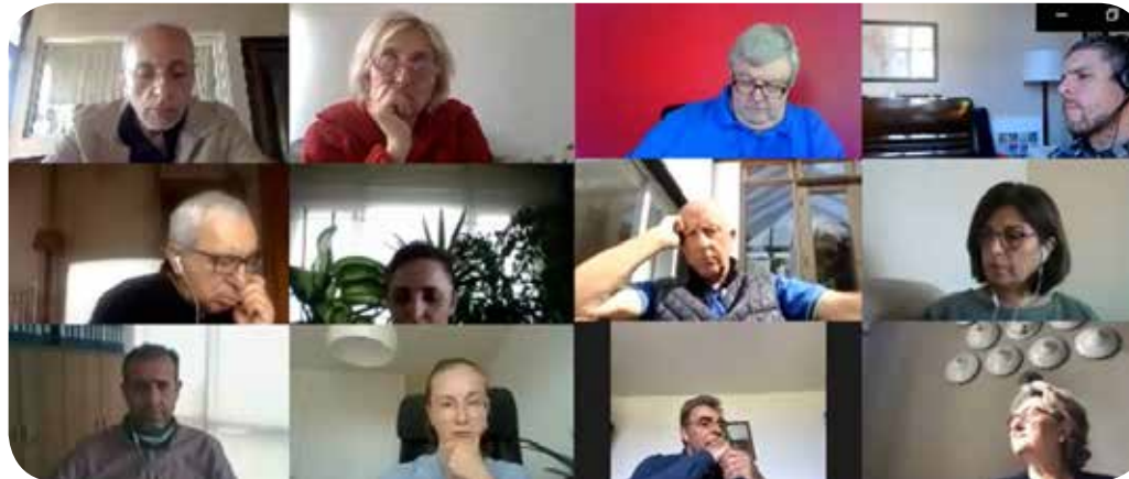
Participants during the online roundtable meeting.

With regards to HDP's backdoor diplomacy, a participant asked what methods will HDP use to build relationship with İYİ Party and two newly founded parties. Buldan said that before the last HDP congress she stated that all the alliances should be transparent and HDP