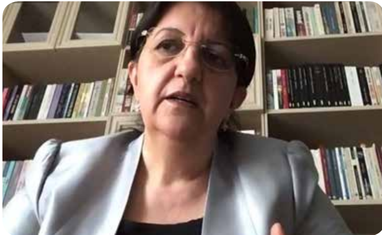
Pervin Buldan, MP&co-chair of Peoples' Democratic Party (HDP)

During this pandemic crisis, as part of various measures to fight against COVID-19 in prisons across the country, the government in-