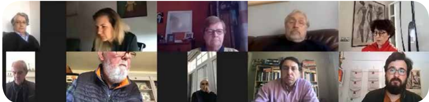
Participants during the discussion session

The region around Ağrı lacks an adequate health care system, which means that people have to travel to other cities to receive medical treatment. In the region, extended family structures are common, which might exacerbate the spread of the virus. HDP has tried to