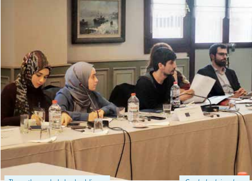
The youth group look ahead and discuss their own vision of peace in Turkey