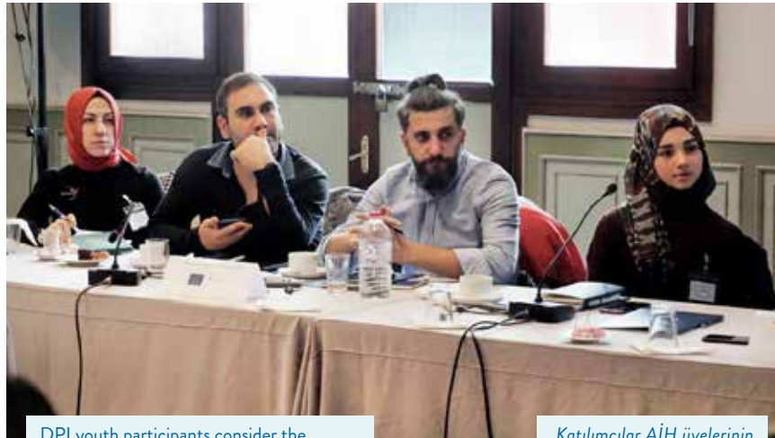
DPI youth participants consider the experiences of the former WPC members