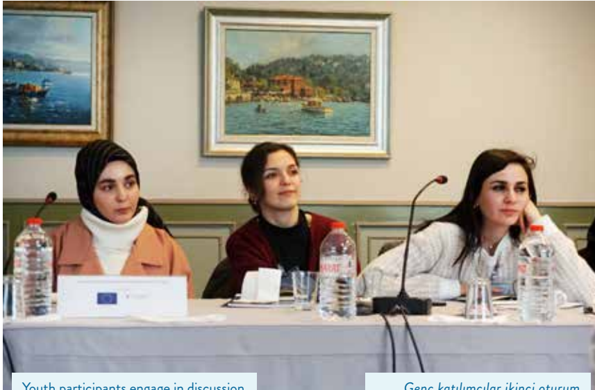
Youth participants engage in discussion on their own memories of the Turkish resolution process

Amongst the participants who were more aware of political developments at the time of the peace process, several remembered feeling very hopeful about it. In particular, participants recalled great feelings of solidarity at the time of the resolution process. One of the participants cited the example of Öcalan's letter for Newroz in 2013. She stated that in her workplace everyone had been waiting for the letter to be shared as it was historical moment. She mentioned that the feelings of communion and solidarity were felt so deeply that even those of Armenian descent wished to be included in his statement. Another participant also remembered the Newroz celebrations of 2013 as a moment