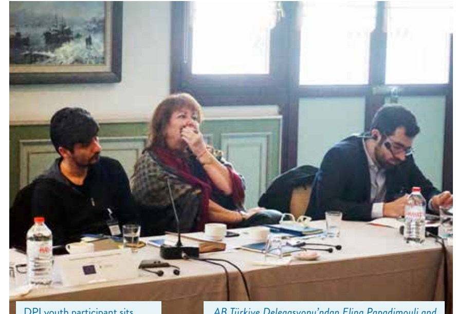
DPI youth participant sits alongside EU representatives Elina Papadimouli and James Rizzo

Bazı katılımcılar, barış sürecini raydan çıkararak konular olduğunu düşündükleri bazı başlıkları sıraladılar. Bunlardan biri, söz konusu tarafların, müzakereler hakkında kamuoyuna yeterli bilgi vermeyi bir öncelik yapmamalarıydı. Coşkun, bu noktada, AİH Türk halkına nasıl yaklaşılacağı konusunda bile gerçek bir stratejisi olmadığını ekledi. Temsiliyetin yeterli olacağı ve yukarıda bir karar alındıktan sonra geri kalanın doğal olarak bunu takip edeceği varsayımının yapıldığını söyledi. Bir katılımcı AİH'nin karar alma bakımından çok güçsüz olmasının da süreci olumsuz yönde etkilediğini belirtti. Yine sürecin çok fazla siyasallaşmasının da negatif bir durum yarattığının altını çizdi. Kürt meselesi çok karmaşık bir konu olduğundan müzakerelerin parti siyasetlerinin ötesine geçmesi gerektiğini belirtti. Katılımcı, AİH'nin tarafsız bir izleme kurulu olarak istihdam edilebileceğini, ancak o dönem kendilerine verilen rolün bu olmadığını ve tarafların kendi başlarına görüşerek kötü gidişe daha çom alan açıldığını söyledi.