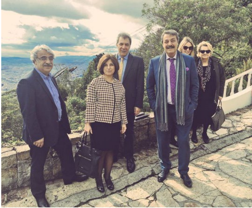
DPI karşılaştırmalı çalışma gezisi katılımcıları ve DPI çalışanları Bogota'da bulunan Monserrate Mabele bölgesinde

katılan ve toplumsal cinsiyet perspektifine dayalı öneriler yapan uzmanların oynadığı önemli rollere de vurgu yapmışlardır. Aralarında eski bir savaşçı kadının olduğu müzakerelerde yer alan önemli kadın aktörlerden bazıları düzenlenen yuvarlak masa toplantılarında toplumsal cinsiyet perspektifi üzerinden tecrübelerini birinci elden katılımcılarla paylaşmıştır.