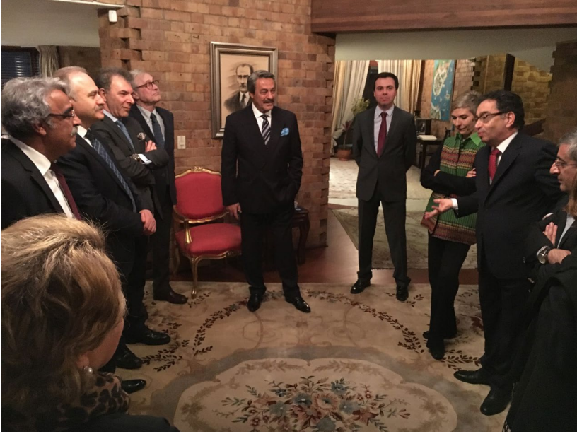
DPI karşılaştırmalı çalışma ziyareti katılımcıları Türkiye Cumhuriyeti Kolombiya Büyükelçiliği tarafından onurlarına verilen resepsiyon sırasında

Geniş olarak tartışılan bir diğer mesele resmi ya da çift taraflı bir ateşkesin olmadığı koşullarda şiddetin yeniden baş göstermesinin hem devletin silahlı kuvvetleri hem de gerilla güçleri üzerinde etkisinin ne olduğu konusu olmuştur. Konuşmacılardan bir bölümü sürecin içeride gelişen şiddet olaylarından etkilenmemesini sağlamak için, görüşmelerin ülke dışında bir yerde yapılmasının önemli olduğuna, bu sayede aktif çatışmalara rağmen sürecin rayında tutulabileceğine vurgu yapmışlardır. Tarafların, DDR (Silahsızlanma, Silahlı Savaşçıların Terhisi ve Toplumla Yeniden Kazandırma) sürecinin ne şekilde ve ne tür bir takvim çerçevesinde işleme gerektiğine dair farklı görüşlere sahip olmasının sıklıkla karşılaşılan bir durum olduğuna vurgu yapan konuşmacılar, bu