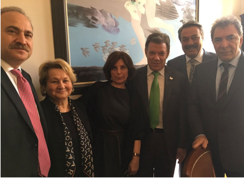
DPI karşılařtırmaı çalıřma ziyareti katılımcıları Levent Gök, Kezban Hatemi, Sevtap Yokuř, Kadir İnanır ile DPI İcra Kurulu Bařkanı Kerim Yıldız, Kolombiya Devlet Bařkanlıęı Sarayında dzenlenen toplantı sırasında Kolombiya Devlet Bařkanı Juan Manuel Santos Calderón ile birlikte

Karşılařtırmaı çalıřma ziyareti sırasında Kolombiya barıř sürecinin temel temalarının üzerinde durulmuř, bu temaların derinden analiz edilmesi ve ülkenin çatıřmalardan en fazla etkilenen bölgelerinde zaman geçirilmesi sayesinde katılımcıların Kolombiya örneęini ve bu örnekten çıkarılabilecek dersleri kapsamlı bir řekilde kavramasına olanak yaratılmıř, bu sayede katılımcıların hafta boyunca ilgili konuları hem Kolombiya hem de Türkiye örneęi üzerinden kendi aralarında tartıřması saęlanmıřtır.