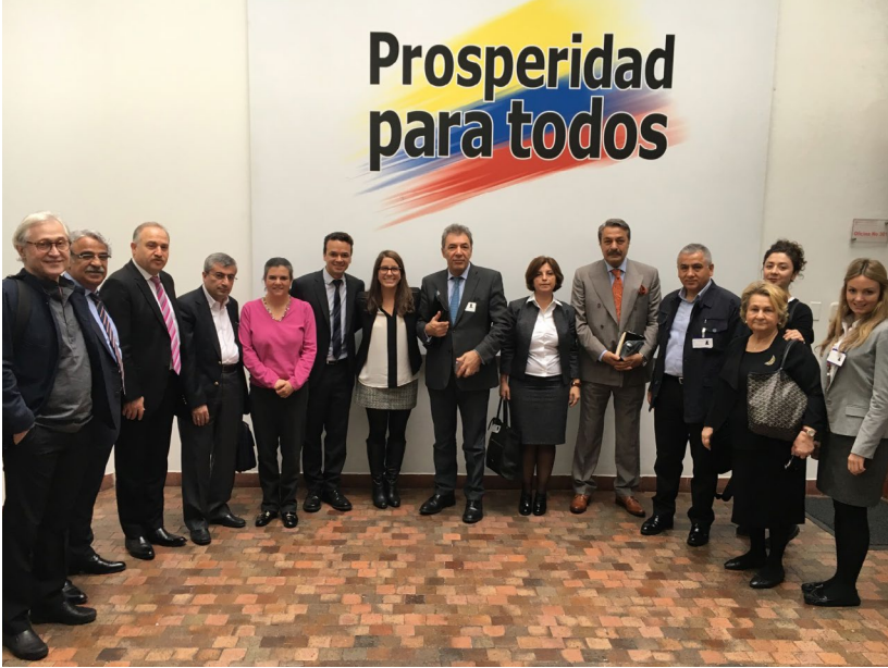
Karşılařtırmaalı alıřma ziyareti katılımcıları Kolombiya Hkmeti Barıř Yksek Komiserlięi Ofisi ile gerekleřtirilen grřme sonrası toplu halde

saęlayabilecekleri de ayrıntılı olarak tartıřılmıřtır. Havana'da devam eden mzakere masasında Kolombiya iř dnyasından temsilcilerin yer alıyor olması ayrıca detaylı olarak tartıřılmıřtır.