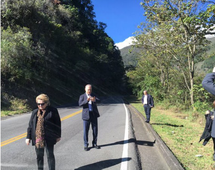
DPI karşılařtırmaalı alıřma ziyareti katılımcıları Kolombiya'nın atıřmalardan en fazla etkilenen blgesi Nariño'nun San Juan de Pasto řehrine gerekleřtirdikleri ziyaret sırasında

ile medya ilgisinden uzak bir řekilde Kolombiya tecrubesinden ilgili dersleri ıkarmak zere 1 hafta srecek bir alıřma ziyareti kapsamında bir araya gelmeleri iin bir karşılařtırmaalı alıřma ziyaretine katılmaya davet etmiřtir.