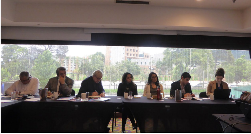
DPI karşılaştırmalı çalışma ziyareti katılımcıları, Fundación Ideas para la Paz (Barış İçin Fikirler Vakfı) temsilcileriyle gerçekleştirilen Kolombiya barış sürecinde iş dünyası liderlerinin rolü konulu yuvarlak masa toplantısı sırasında

Bütün katılımcılar ziyaret sayesinde edindiklerini ilgili toplumsal kesimler ve hitap ettikleri çevrelerle kapsamlı raporlar ve yazılar üzerinden paylaşacaklarını ifade etmişlerdir. Siyasi partileri temsilen ziyarete katılan isimler ise parti organları ve liderlerine rapor şeklinde bildirimlerde bulunacaklarını, Cumhurbaşkanlığı ve başbakanlık makamlarına danışman olarak hizmet veren katılımcılar da edindiklerini raporlar yoluyla ilgili makamlara bilgi halinde vereceklerini ifade etmişlerdir. Katılımcılar arasında bulunan gazeteciler ve medya temsilcileri ise ziyaret boyunca gözlemlerini köşe yazıları yazmak yoluyla kamuoyuyla paylaşmışlardır. Örneğin ziyaretin ilk gününü kapsayan gözlem ve görüşlerden oluşan köşe yazılarından bir tanesi, yazarının yazılarının normalde gördüğü ilginin 4 katına çıkarak 44.000 kişi tarafından okunmuştur. Sivil toplum örgütlerini temsilen ziyarete yer alan katılımcılar edindiklerini çeşitli şekillerde hitap ettikleri