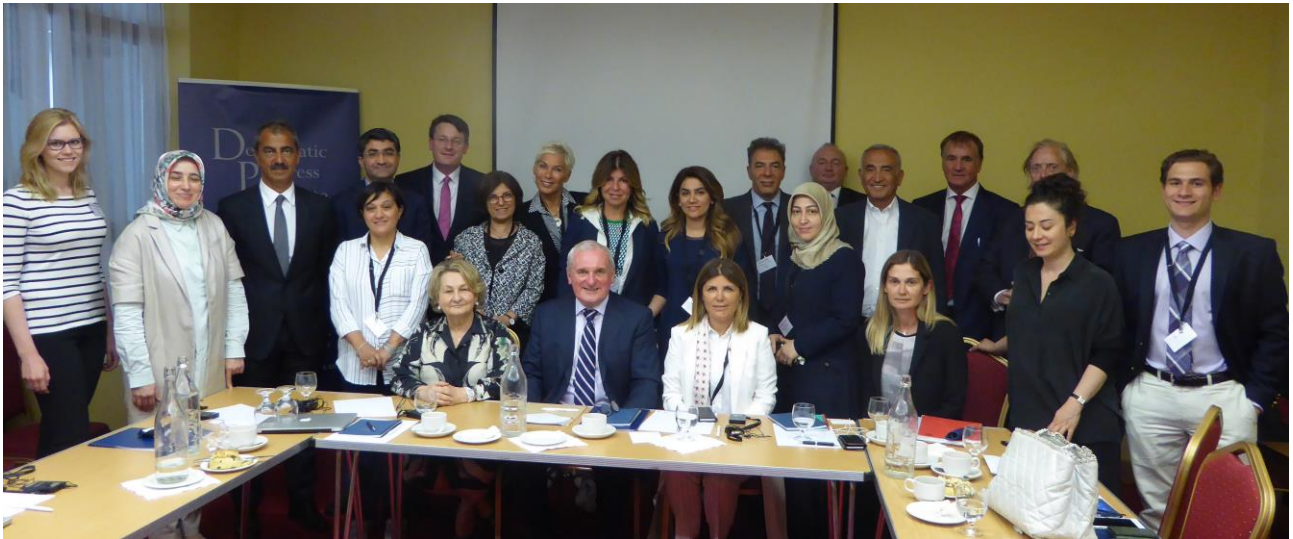
İrlanda eski Taoiseach'ı Bertie Ahern ve katılımcılar.

Bu, DPI'nın çatışma ve ekonomi arasındaki ilişkiyi ve iş dünyasının barışı desteklemedeki rolünü keşfetmek amacıyla gerçekleştirdiği ilk ziyaretti; DPI bunları çatışma çözümü sürecine giden yolda önemli faktörler olarak görür. Ziyaret, DPI'nın ilgili konulardaki çalışmalarını tamamlamakta ve onlara ekte bulunmaktadır: barış süreçlerinde kadınların ve sivil toplumun görevi, zor zamanlarda sürecin ve diyalogun devam etmesinin nasıl sağlanacağı bu konular arasında sayılabilir. Aynı zamanda, tüm tarafların güvensizlik içinde olduğu ve ülkenin güneydoğusunda şiddetin devam ettiği şu koşullarda, Türkiye'nin tecrübe etmekte olduğu zor zamanların, toplumu barış sürecinin hız kazanacağı ana hazırlamak için önemli bir fırsat olduğuna dair DPI'nın duyduğu inancı da yansıtmaktadır.