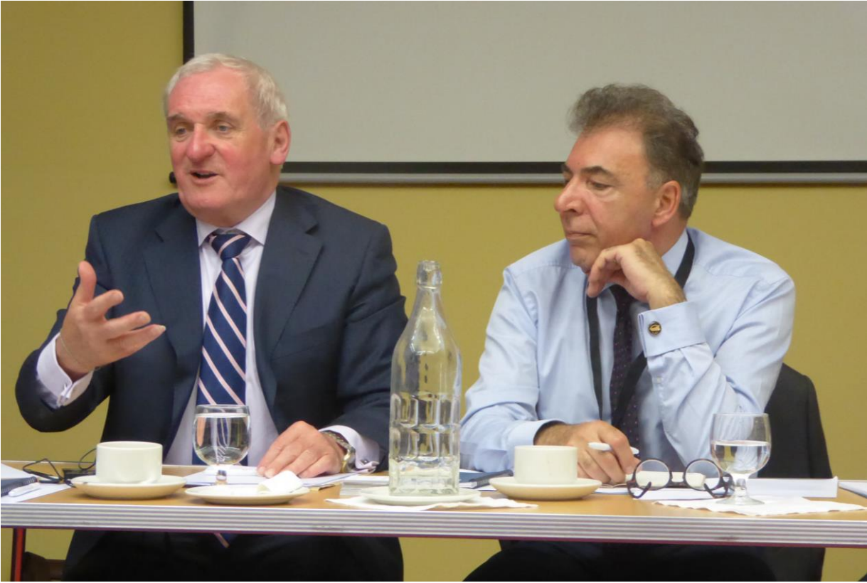
Bertie Ahern ve DPI CEO'su Kerim Yıldız

Katılımcı Sorusu: Kadın gruplarının çok başarılı olduğundan bahsettiniz; bu grupların faaliyetlerini biraz daha açıklayabilir misiniz? Örneğin protestolara katılmak haricinde bölgedeki kadınlar nasıl güçlerini kullandılar?