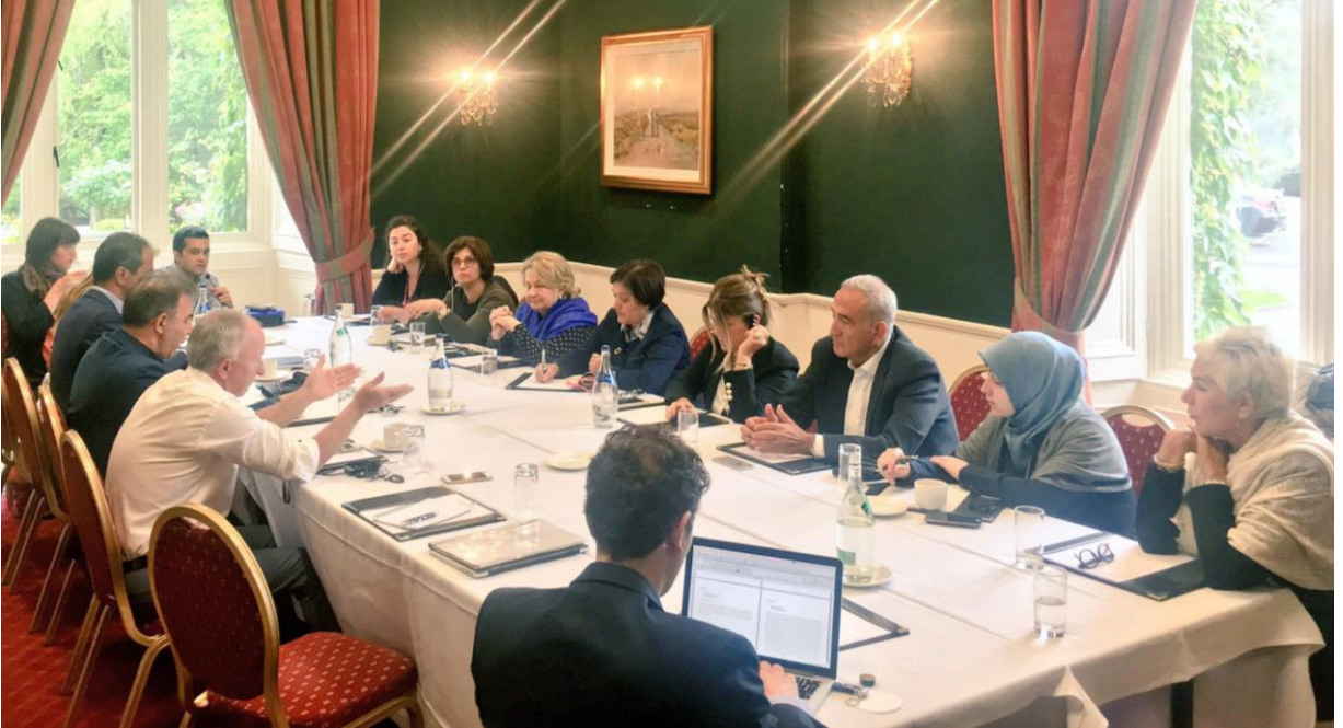
Dermot Ahern ile yuvarlak masa toplantısı

Dermot Ahern: Daha kötü olurdu diye düşünüyorum. Zamanında teknoloji açısından kabinedeki en ileri kişi bendim, ama sosyal medyadan pek hazzetmiyorum. İrlandaca'nın sorun yarattığını söylemiştim, bu anlaşma imzalanırken aynı zamanda bayraklar ve flamalarla ilgili bir anlaşma da yapılmıştı. İrlanda Cumhuriyeti'nde bayraklar konusunu pek önemsemiyoruz. Hayırlı Cuma Anlaşması'nda büyük bir sorun haline gelmişti; bayraklar ve flamalar konusu üzerinde saatlerimizi harcadık. Kuzey İrlanda parlamentosu, Birleşik Krallık bayrağının 17 önemli günde asılabileceğini kabul etti, milliyetçiler de bunu kabul etti. Belfast şehir konseyinde milliyetçiler çoğunlukta idi, Birleşik Krallık bayrağının yılda 17 kere asılabileceğine dair geçirmeye çalıştıkları karara birlikçiler karşı çıktı. Bu esnada Belfast kalkınmaya başlamış bir şehirdi artık. Fakat sosyal medya sayesinde tartışma büyüdü ve saatler içinde, daha önce hiç protestolara katılmamış 10.000 genç bu bayrak meselesi yüzünden sokağa döküldü. Artık sosyal medyanın olmadığı bir siyaset düşünmek mümkün değil; bu sebeple, siyaseti bıraktığım için mutluyum.