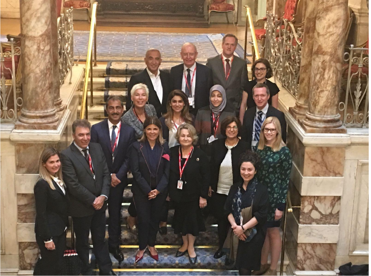
Iveagh House, Irish Department of Foreign Affairs and Trade