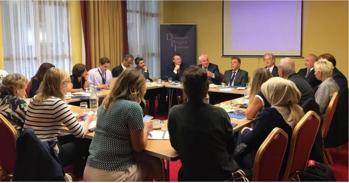
Bertie Ahern ile yuvarlak masa toplantısı

EuropaGrid’de yaptığımız şu: Fransa ve Birleşik Krallık arasında bir dönüştürücü istasyonumuz var, bu istasyon deniz altındaki kablolarla bir gigawatt’lık enerji sağlıyor. Görebileceğiniz gibi bunlar oldukça siyasi ve zor projeler. Ticari projeler oldukları için bunlar hususi kablolar, ve AB’nin bize tanıdığı muafiyetler var. Fakat Brexit bu kablonun anlamını tamamen değiştirmiş durumda. En önemli projelerimiz Akdeniz ringini tamamlayan ve Kuzey Afrika, İspanya ile İtalya’daki şebekelere enerji veren projelerimiz. Türkiye ve Romanya’nın yanısıra Türkiye ve Kıbrıs arasında rotalar tespit ettik, aynı zamanda Ortadoğu ve Türkiye arasında rotalar da tespit ettik. Projeleri önce hayal edip sonra uygulamaya geçiyoruz, sonra da siyasi evre geliyor ki, bu hepsinden daha zor. Dünyada bu işi birkaç proje olarak yürüten tek işletmeyiz, boru ara parçalarının çoğu zor ve sıradışı. Akıllı sayaç lisanslarımız Avrupa’da ve bu işin yaygın olmadığı pazarlarda mevcut. Akıllı sayaçlar aracılığıyla sınır ötesi elektrik ticareti yapılmasını sağlayan Electrina gibi platformlarımızın yolunu açmaya çalışıyoruz. Bu ticaretin sonucu olarak insanlar arabalarını şarj edebilecekler yahut şirketlerine enerji sağlayabilecekler.