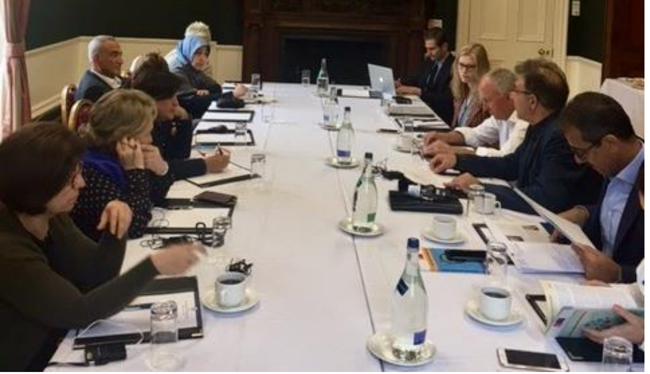
Dermot Ahern ile yuvarlak masa toplantısı

İngiliz hükümeti uzun yıllardır Kuzey İrlanda'nın haznedarı rolünde, ekonomileri kamu sektörü tarafından ayakta tutuluyor, burada ise ekonomiyi özel sektör götürüyor. Birkaç yıl önce ekonomik duraklama yaşamamıza rağmen –partim de bu yüzden artık hükümette değil—ülkemiz hala son derece girişimci. Dünyadaki başlıca çokuluslu şirketlerin hepsinin İrlanda'da genel merkezi var. Google, Ebay, PayPal, Twitter, Facebook, hepsinin Avrupa genel merkezi İrlanda'da.