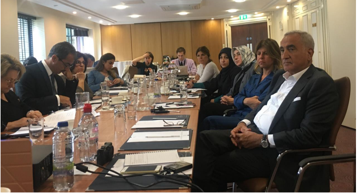
David Mitchell ile yuvarlak masa toplantısında katılımcılar

sorunlar konusunda daha ciddileştiler ve Kuzey İrlanda'nın uluslararası maçlarını daha aile dostu yapmaya çalıştılar, çünkü bu maçlara ağırlıklı olarak erkekler gidiyordu ve çok maço bir atmosfer hakimdi. Dernek artık mezhepçi olaylar konusunda çok daha sert davranıyor, bu alanda başarı sağlandı ve diğer bölünmüş toplumlar için kullanılabilecek uluslararası bir model olarak gösteriliyoruz. İkinci olarak, topluma daha açık olabilmesi ve İrlanda oyunlarının tanıtılması için bazı GAA kuralları değiştirildi. Ragbi profesyonelleşerek değişti, artık daha yüksek profilli ve başarılı bir spor. Bu sayede daha geniş ve çeşitli bir takipçi kitlesi de oluştu.