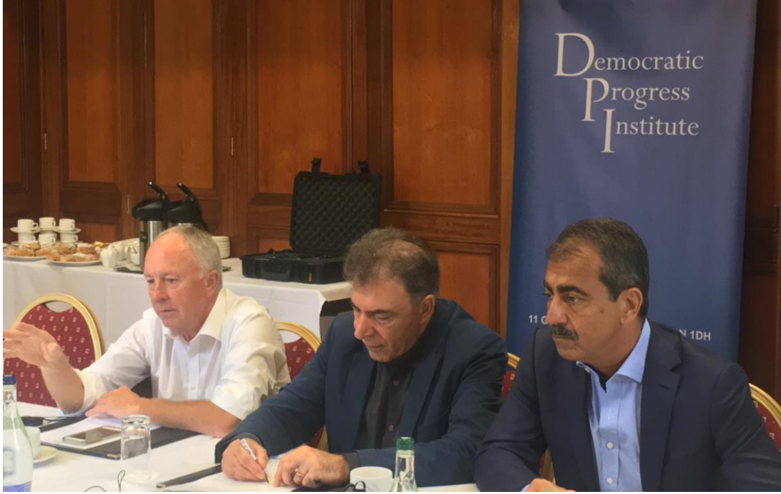
Eski Dışişleri ve Ticaret Bakanı Dermot Ahern, Kerim Yıldız ve Laki Vingas

Kerim Yıldız: Bazılarınız Dermot Ahern'i tanıyorsunuz. Kendisine müteşekkiriz, çünkü DPI'nın ilk danışmanlarından biriydi ve bize adını ödünç veriyor. Projemizde bize aktif olarak yardımcı oluyor ve çalışmalarımıza katkıda bulunabilmek için elinden geleni yapıyor. Türkiye'ye de birkaç kez seyahat etti, yakın zamanda yine oradaydı. Kendisini tanıtması için sözü ona vereceğim, ama ben de kısa bir tanıtım yapayım: kendisi eski Dışişleri ve Ticaret Bakanı. Bakanlıktaki zamanı süresince bir çatışma çözümü birimi geliştirdi ve departmanına para kazandırdı. Bugün Dermot'tan uzun bir sunum yapmasını istemek yerine daha çok soru-cevap tarzında bir oturum yapacağız. Son birkaç gündür iş dünyasından kişileri ve barış sürecindeki pek çok diğer aktörü dinliyoruz; ticarete, ekonomiye ve sürece dair sorularınız olabilir. Başlayalım.