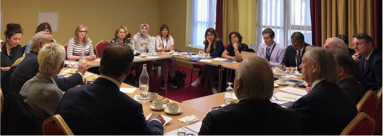
Bertie Ahern'le yapılan yuvarlak masa toplantısında katılımcılar

Geldiğiniz için teşekkürler, umarım ziyaretiniz keyifli geçer. Ben perakendeciyim. İyi talihimin çoğunu kadınlara borçluyum; büyükannem 1937'de bir perakende satış işi kurdu. Gençken terziymiş. İlginçtir, büyükbabam İrlanda'nın kuzeyindendi, güneye taşınıp tesisatçı olarak çalıştı ve 1935'de büyükannemle evlendi. Başbakan Ahern kuzey-güney ayrımı nedeniyle yaşanan zor zamanlardan bahsetti. Büyükbabam Protestandı, büyükannem ise Katolik, fakat çocuklar kilise geleneği uyarınca Katolik olarak yetiştirildiler. O zamanın gerekliliği evlenmek için kiliseden izin almaktı. Sadece izin almak yetmiyordu, aynı zamanda mihrapta değil mihrabın kenarında evlenmeniz gerekiyordu.