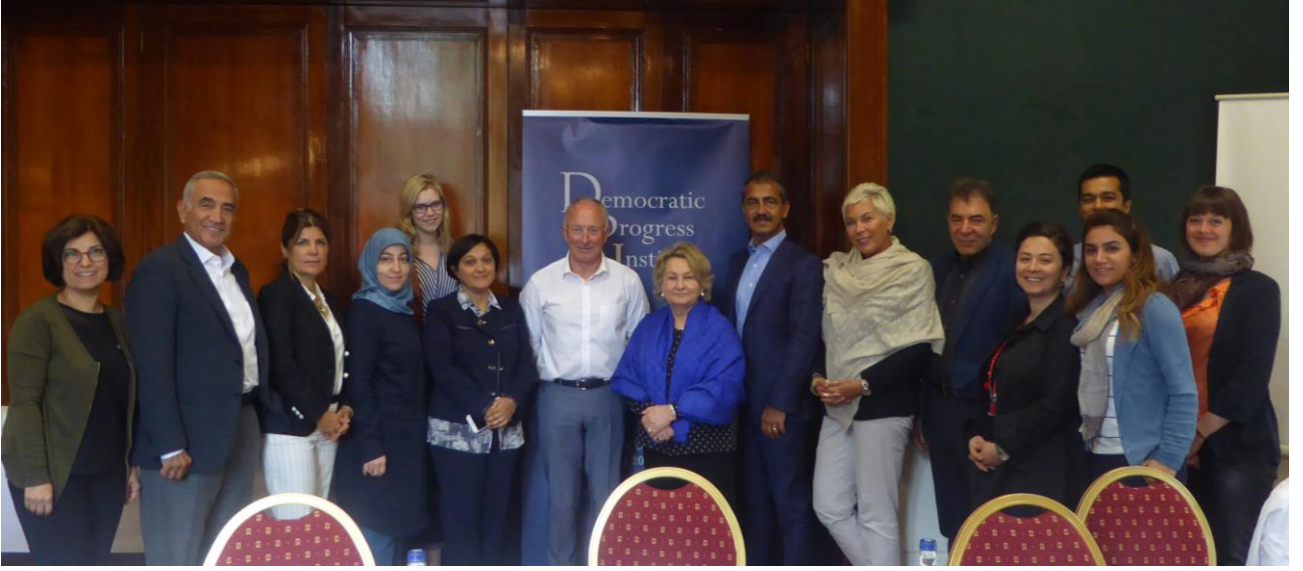
Katılımcılar ile İrlanda Eski Dışışleri ve Savunma Bakanı, Dermot Ahern