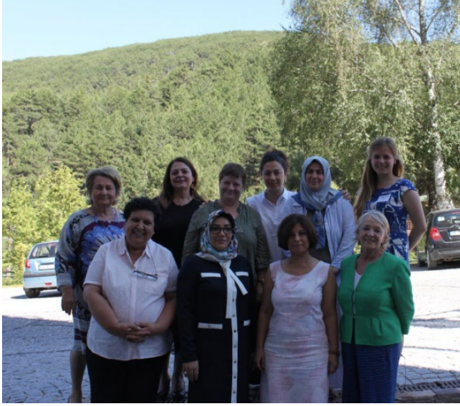
DPI tarafından Ankara Kızılcahamam'da düzenlenen yuvarlak masa toplantısına katılan konuşmacılar ve katılımcılar toplu halde