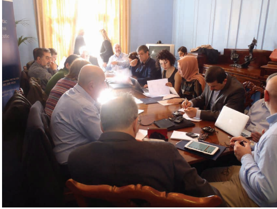
Katılımcılar Dublin'deki Boston Kolejinde düzenlenen yuvarlak masa toplantısı sırasında

Taraflar arasındaki ilk görüşme ve konuşmalar özellikle Güneyde bulunan ve verilen tavizleri kabul edilmez bulan medya kesimlerinin saldırısına uğradı. Süreç sırasında tartışılan bazı zorlu konular vardı. Mesela cezai yaptırımlar ve kimlik sembolleri gibi konular bunlardan bir kaçıydı. Bu noktadaki çözüm üstesinden hemen gelinemeyen bu sorunların bir süre için bir yana bırakılması ve barış, ekonomik kalkınma, kamusal alandaki korkuların azaltılması gibi konulara yoğunlaşılıyordu. Bu bağlamda akılda tutulması gereken bir diğer konuda Britanya hükümetinin çözümün sağlanmasına ihtiyaç olduğuna ikna olmasıydı. Birlikçi Parti varlığını Britanya ile olan bağa borçluydu. Ancak onlarda Britanya hükümetinin onların üzerine geliştirdiği baskıya boyun eğmek zorunda kaldılar.