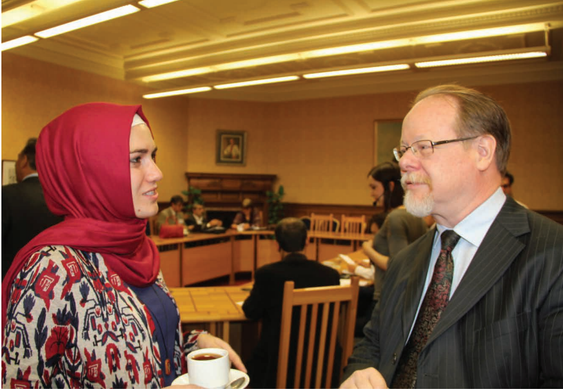
İrlanda Dışişleri ve Ticaret Bakanlığında gerçekleştirilen Yuvarlak Masa Toplantısı

Hayırlı Cuma Anlaşmasının referandum sonucunda kabul edildiğinden bahsetmiştim. Referandumun Kuzey İrlanda'da düzenlenmesi süreci doğrudan gerçekleştirilmiştir. Ancak Güney'de yani İrlanda Cumhuriyetinde bu referandumu sağlamak için anayasa değişikliğine gidilerek İrlanda'nın Kuzey İrlanda üzerindeki egemenlik iddiası ortadan kaldırılmıştır. İrlanda tarihinde önemli bir dönemeç olan bu referandum sonrasında anlaşma % 85 oranında bir oyla kabul edilmiştir. Anlaşmanın kabul edilmesi bir anlamda kendi kaderini tayin girişimi gibiydi ve sürece dahil olan bütün taraflara bir meşruiyet kazandırmıştır. Anlaşmanın kabulü bir yandan büyük bir siyasi başarı iken, aynı zamanda pek çok yönden barışın inşası sürecinde başlangıcıydı. Elbette süreç çinde duraklamalar yaşanmıştır. Hala sürece tümünden karşı olan ve