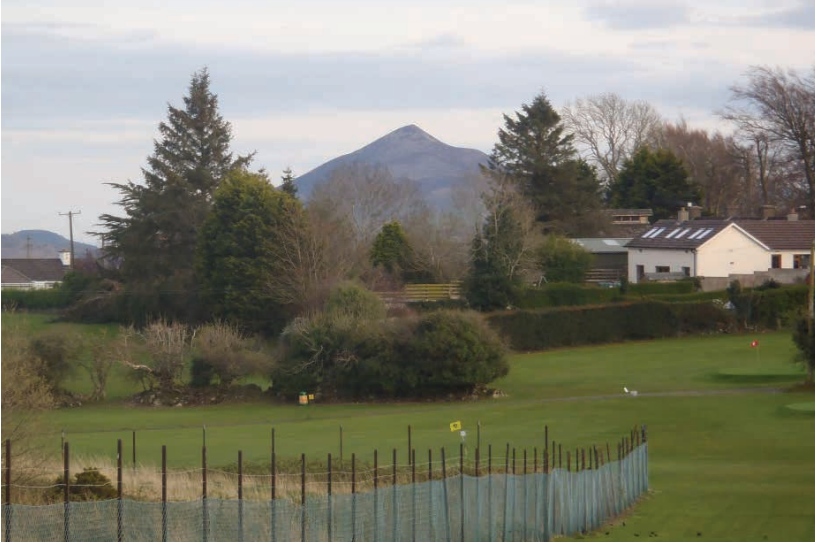
Dublin Dağlarının bir Manzarası